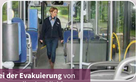
Bei der Evakuierung von Bussen alles im Blick?