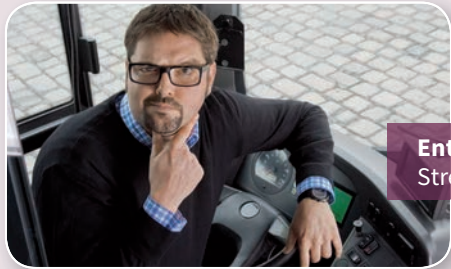
Entspannter Umgang mit Stresssituationen?