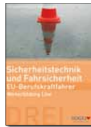
Arbeits- und Lehrbuch Sicherheitstechnik und Fahrsicherheit Broschüre, 17 x 24 cm Bestell-Nr. 24736