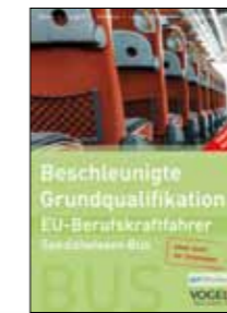
Trainer-Handbuch Spezialwissen Bus