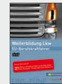
PC-Professional Tank und Silo Bestell-Nr. 24757