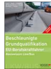
Trainer-Handbuch Basiswissen Lkw/Bus