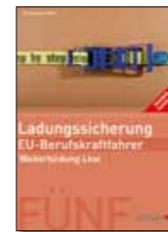
Trainer-Handbuch Ladungssicherung Broschüre, 17 x 24 cm Bestell-Nr. 24745