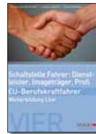
Arbeits- und Lehrbuch Schaltstelle Fahrer: Dienstleister, Image-träger, Profi Broschüre, 17 x 24 cm Bestell-Nr. 24741