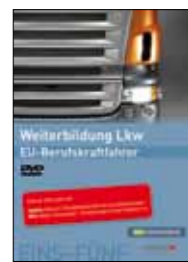
Eco-Training DVD mit Videos und Animationen Für Neukunden Bestell-Nr. 24727 Für Bestandskunden Bestell-Nr. 2472701

Der hochwertige Sammelordner schafft Ordnung.