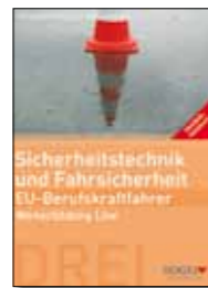
Trainer-Handbuch Sicherheitstechnik und Fahrsicherheit Broschüre, 17 x 24 cm Bestell-Nr. 24735