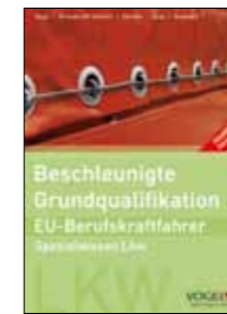
Trainer-Handbuch Spezialwissen Lkw