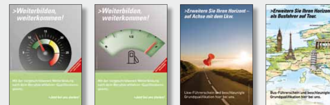
Poster DIN A1 Weiterbildung Lkw Bestell-Nr. 14210

Mit unseren Werbematerialien stellen Sie Ihr Schulungsangebot attraktiv, informativ und zielgruppengerecht in den Mittelpunkt!