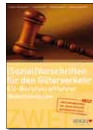
Arbeits- und Lehrbuch (Sozial)Vorschriften für den Güterverkehr Broschüre, 17 x 24 cm Bestell-Nr. 24731