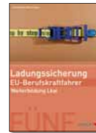
Arbeits- und Lehrbuch Ladungssicherung Broschüre, 17 x 24 cm Bestell-Nr. 24746