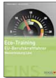
Arbeits- und Lehrbuch Eco-Training Broschüre inkl. Sammelordner, 17 x 24 cm Bestell-Nr. 24726Z

Fragen Sie nach unseren günstigen Preisstaffeln!