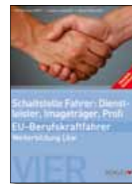
Trainer-Handbuch Schaltstelle Fahrer: Dienstleister, Image-träger, Profi Broschüre, 17 x 24 cm Bestell-Nr. 24740