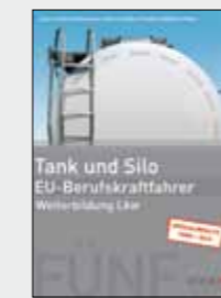
Arbeits- und Lehrbuch Tank und Silo Bestell-Nr. 24756

Ein komplettes Modul mit 7 Stunden für Tank- und Silofahrer!