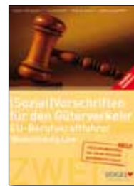
Trainer-Handbuch (Sozial)Vorschriften für den Güterverkehr Broschüre, 17 x 24 cm Bestell-Nr. 24730