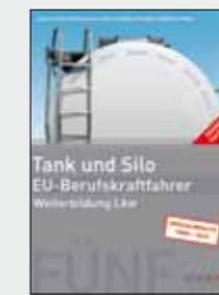
Trainer-Handbuch Tank und Silo Bestell-Nr. 24755