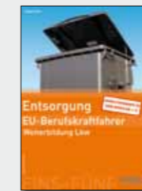
Arbeits- und Lehrbuch Entsorgung Bestell-Nr. 24751

Gehen Sie in jedem Modul vom allgemeinen zum speziellen Entsorgungswissen!