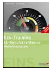
Trainer-Handbuch Eco-Training Broschüre inkl. Sammelordner, 17 x 24 cm Bestell-Nr. 24725Z

Der hochwertige Sammelordner hilft Ihnen beim Abverkauf aller Module.