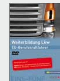
PC-Professional Entsorgung Bestell-Nr. 24752