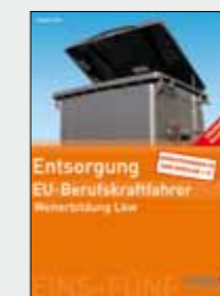
Trainer-Handbuch Entsorgung Bestell-Nr. 24750